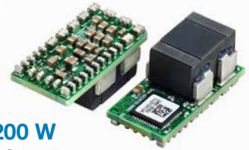
200 W LGA80D